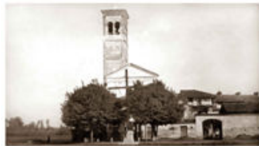
Omaggio del "Cine Foto Club Trebate" ai soci per l'anno 2007

Scheda d'iscrizione da compilare al Club o presso Distributore Agip di Pizzo Gianni