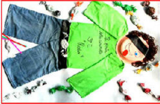
Il Pirata delle Caramelle 3a E