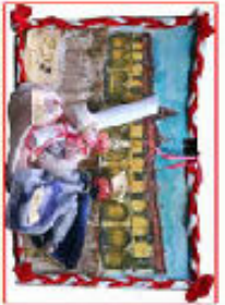
"Barbula e Ghita" 2a D