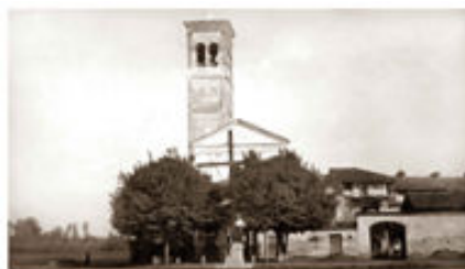
Omaggio del "Cine Foto Club Trecate" ai soci per l'anno 2007

Scheda d'iscrizione da compilare al Club o presso Distributore Agip di Pizzo Gianni