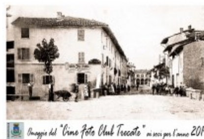
Omaggio del "Cine Foto Club Treccate" ai soci per l'anno 2014

Per il prossimo Anno 2014 il Cine Foto Club Treccate, a tutti i Soci che regolarmente si iscriveranno, offrirà in omaggio l'immagine A Punt da Busca e via Matteotti, ovvero una fotografia della vecchia Treccate tratta dal nostro archivio storico.