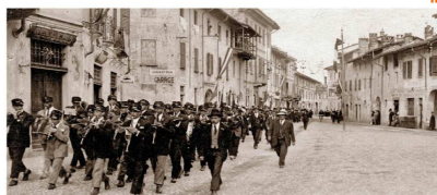
Omaggio del "Cine Foto Club Treccate" ai soci per l'anno 2010

Il costo della tessera, immutato da molti anni, è di 30 Euro