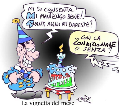
La vignetta del mese