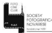
FOTO INCONTRO Manifestazioni fotografiche a NOVARA e dintorni